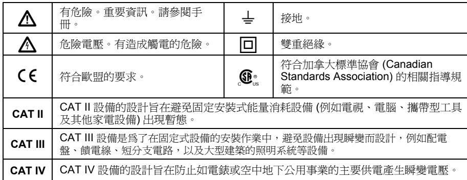
表 1. 符號